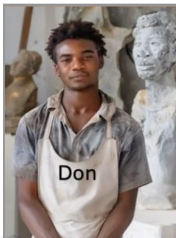
Avatar Don uit digitaal lesmateriaal